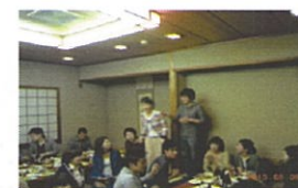
部署毎に自己紹介