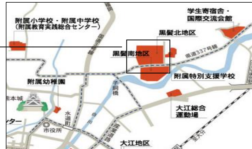
●黒髪北地区拡大図 ⑧くすの木会館