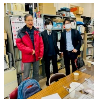
スイーツ会開催の様子